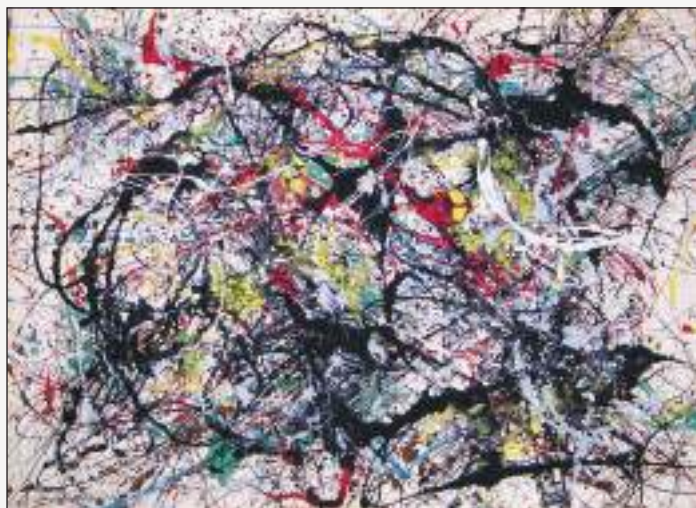
Number 34 by Jackson Pollock